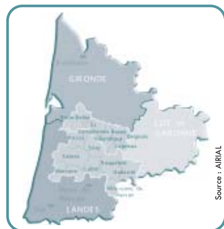
Périmètre du territoire éligible

L' aide LEADER + s'adresse à tout demandeur public ou privé (cela peut donc être un particulier, une association, une entreprise, une collectivité locale ...) qui fera part d'un projet expérimental ou innovant correspondant à la nature des actions inscrites dans le programme. Le programme LEADER + Haute Lande s'applique exclusivement aux communes des cantons du Pays Landes - Gironde , à savoir 8 cantons landais (Gabarret, Labrit, Morcenx, Pissos, Roquefort - à l'exception de la commune de Pouydesseaux, Sabres, Sore, Villeneuve de Marsan) et 6 cantons girondin (Bazas, Belin-Beliet, Captieux, Grignols, Saint-Symphorien, Villandraut).